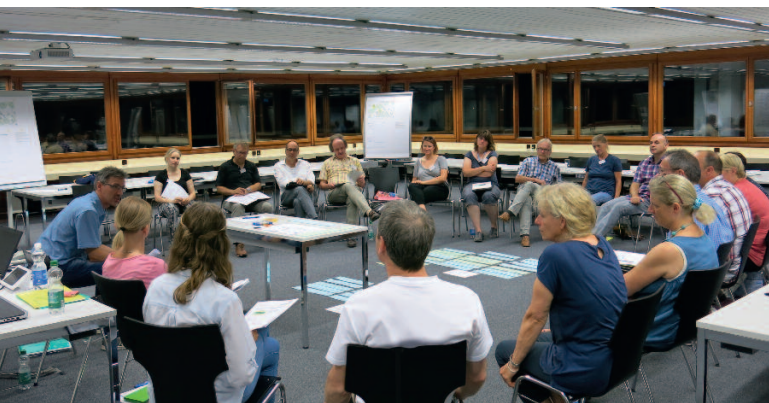
Die Teilnehmerinnen und Teilnehmer der Echoraum-Anlässe diskutierten über die verschiedenen Strategien und Objekte.

Dem Gemeinderat war es ein wichtiges Anliegen, bei der Erarbeitung der Immobilienstrategie auch die Bevölkerung miteinzubeziehen. Aus diesem Grund wurden Vertreterinnen und Vertreter von Parteien, Vereinen und Organisationen zu Echoraum-Anlässen eingeladen.